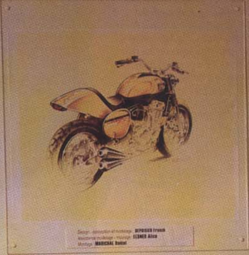
Design: atelier et montage DEPOUER FRANK Assistance montage et montage ELMER AICH Montage MARICHAL DANIEL